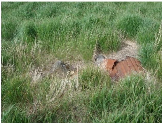
Byrgður brunnur 025, horft til vesturs