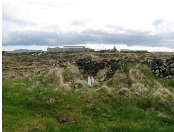
Tóft sambyggð Heiðargarði 021, horft til suðurs

Samkvæmt túnakorti frá 1919 náði Heiðargarður frá Halagerði 020, austast í túni Stóra-Knarrarness, að Vík 144:011, vestast í túni Minna-Knarrarness. Alls var garðurinn um 560 m á lengd og með ströndinni afmarkaði hann svæði sem er um 490x300 m að stærð og snýr nálega austur-vestur. Þar sem garðurinn er horfinn hefur hann verið rifinn vegna útfærslu túna, bygginga og vegagerðar. Garðurinn er grjóthlaðinn og lítið gróinn. Hleðslur eru víða hrundar og er mesta hæð um 1 m og mest sjást 5 umför. Í landi Stóra-Knarrarness er garðurinn um 170 m að lengd, liggur í boga frá suðaustri til suðvesturs. Með fjörunni afmarkarkar hann svæði sem er um 175x78 m að stærð og snýr ASA-VNV. Tóftin er sambyggð túngarðinum. Hún er einföld, um 4x3,5 m að stærð og snýr norður-suður. Innanmál hennar er 2x1,5 m. Í veggjum sjást mest 4 umför hleðslu og hæð þeirra er um 1 m og 1 m á breidd. Tóftin er grjót- og torfhlaðin. Opið inni tóftina er á norðurveggnum. Innan í tóftinni eru leifar af gamalli vírgirðingu. Í landi Minna-Knarrarness er garðbrot sem líklega er hluti af Heiðargarði. Það er um 25 m suðvestan við suðausturenda Brandargerðis 144:016. Það er ógreinilegt, er um 8 m á lengd og um 0,3 m á hæð. Ekki stendur steinn yfir steini. Ekki eru tiltækar upplýsingar um aldur Heiðargarðs og kann hann að vera allgamall í grunninn þó að hann hafi verið endurhlaðinn í gegnum tíðina.