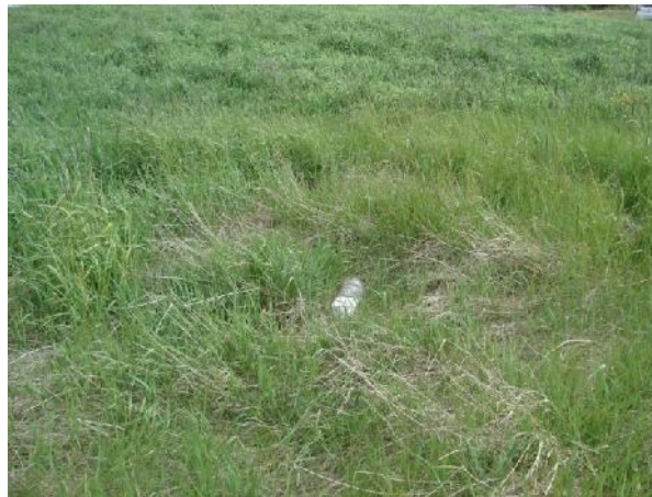
Óljós ummerki um Breiðagerðisbrunn 006, horft til austurs

Heimildir: Ö-Breiðagerði, 2; Túnakort 1919