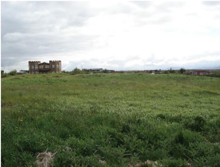
Bæjarhóll Breiðagerðis 001, horft til suðausturs

GK-145:001 Breiðagerði bæjarhóll bústaður