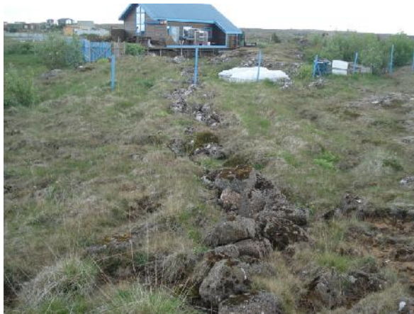
Garðlag 031, horft til austurs