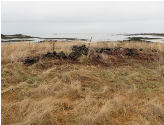
Hleðsla 037, horft til norðurs

að um framhald af hleðslunni sé að ræða og er grjótið í meintum uppmokstri smátt og ekki sést hleðsla. Mögulega er hleðslan sem sést óljósar leifar af Sjóvarnargarði 018 og eru þá aðrir hlutar hans horfnir undir sjávarkamp og vegna landbrots. Mesta hæð hleðslunnar er um 0,3 m en ekki sjást fleiri en eitt umfar grjóts. Mesta breidd hleðslunnar er um 0,5 m.