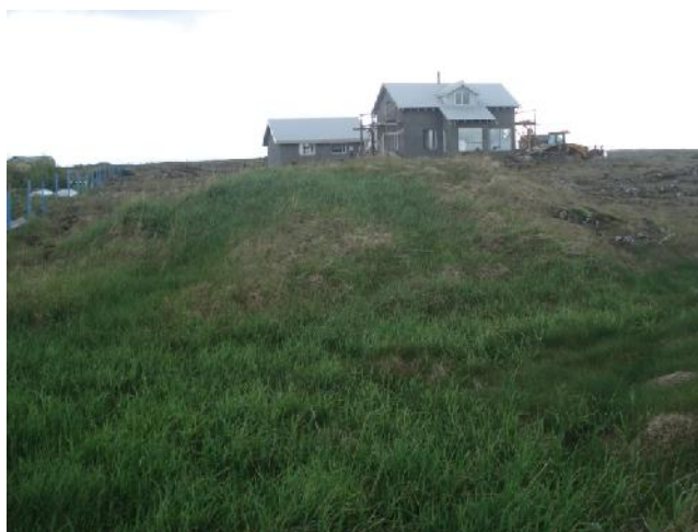
Þúst 030, horft til suðurs

GK-145:030 þúst 64°00.428N 22°19.460V Stór hóll sem líkist rústahól er um 200 m vestan við bæ 001 skammt sunnan við sjávarkamp. Hóllinn er í móa utan túns en fast