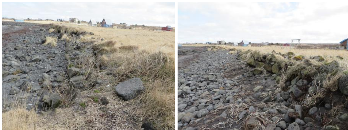
Á vinstri mynd sést garðbútur 012E, horft til ANA. Á hægri mynd sést garðbútur 012D, horft til austurs

stórgrýti er í honum. Hann snýr norðaustur-suðvestur og í honum sjást mest tvö umför hleðslu. Garðbútur C sést á um 20 m löngum kafla, snýr norðaustur-suðvestur. Hann er hruninn og illa farinn af landbroti. Í honum er stórgrýti og má enn sjá tvö umför í hleðslu á stöku stað, mesta hæð um 0,6 m. Garðurinn þjónaði bæði sem sjóvarnargarður og túngarður þar sem hann afmarkaði túnið til VNV. Ekki sjást nein merki um naustið þar sem talið er að það hafi verið og er líklegt að það sjórinn hafi brotið það niður.