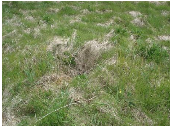
Ummerki um brunn 005, horft til austurs

GK-145:006 Breiðagerðisbrunnur heimild um brunn