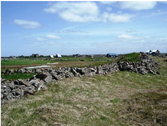
Halagerði 020, horft til austurs