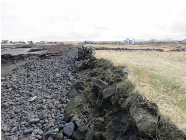
Halagerði 020, horft til austurs. Myndin var tekin í apríl 2016 og sýnir hvernig sjórinn brýtur af norðurhlíð gerðisins

"Innsti hluti túnsins nefnist Halagerði ...," segir í örnefnaskrá. "Innsti (austasti) hluti túnsins (þ.e. Austurbæjartúnsins) nefnist Halagarður," segir í örnefnaskrá KE. Halagerði er um 225 m suðaustan við bæ 001.