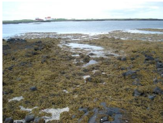
Lending 036, horft til norðvesturs