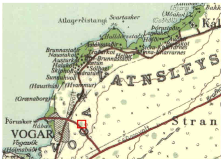
Kort sem sýnir gróflega staðsetningu iðnaðarlóðar við Vogabraut. (Herforingjaráðskort, kort 27)