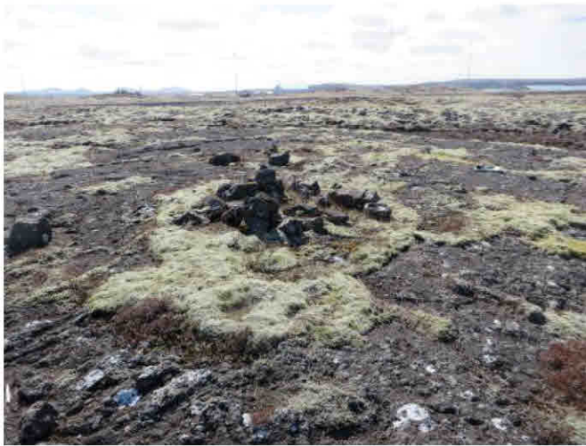
Hleðsla 191, horft til suðurs

Hleðslan er á flatrí hraunhellu í mosagrónu hrauni með grónum lautum inn á milli en einnig er gróðurlaus holmói í hrauninu.