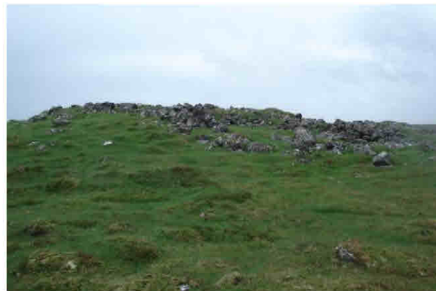
Gíslaborg 064, horft til austurs

Fjárborgin stendur á dálitlum grónum hól í uppgrónu hrauni.