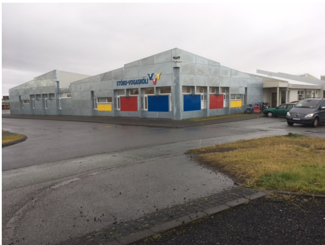
Óskýrar gönguleiðir við Stóru-Vogaskóla.