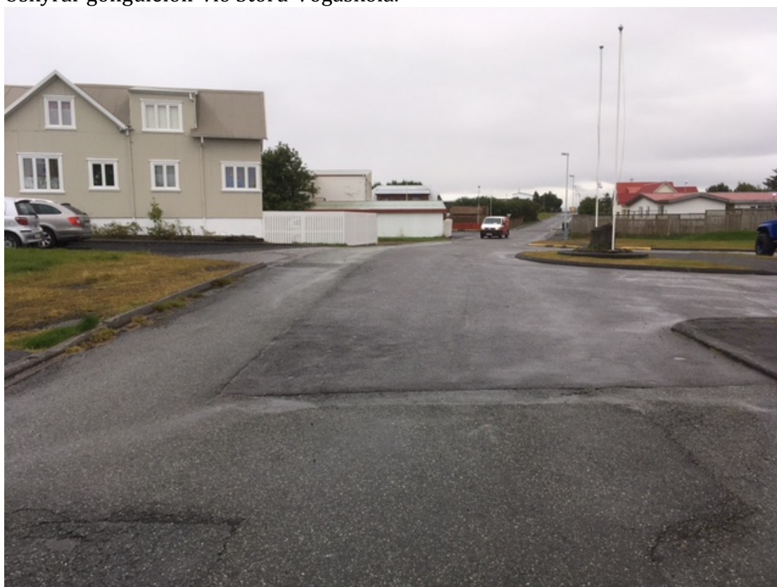
Ástand gatna nærri Stóru-Vogaskóla.