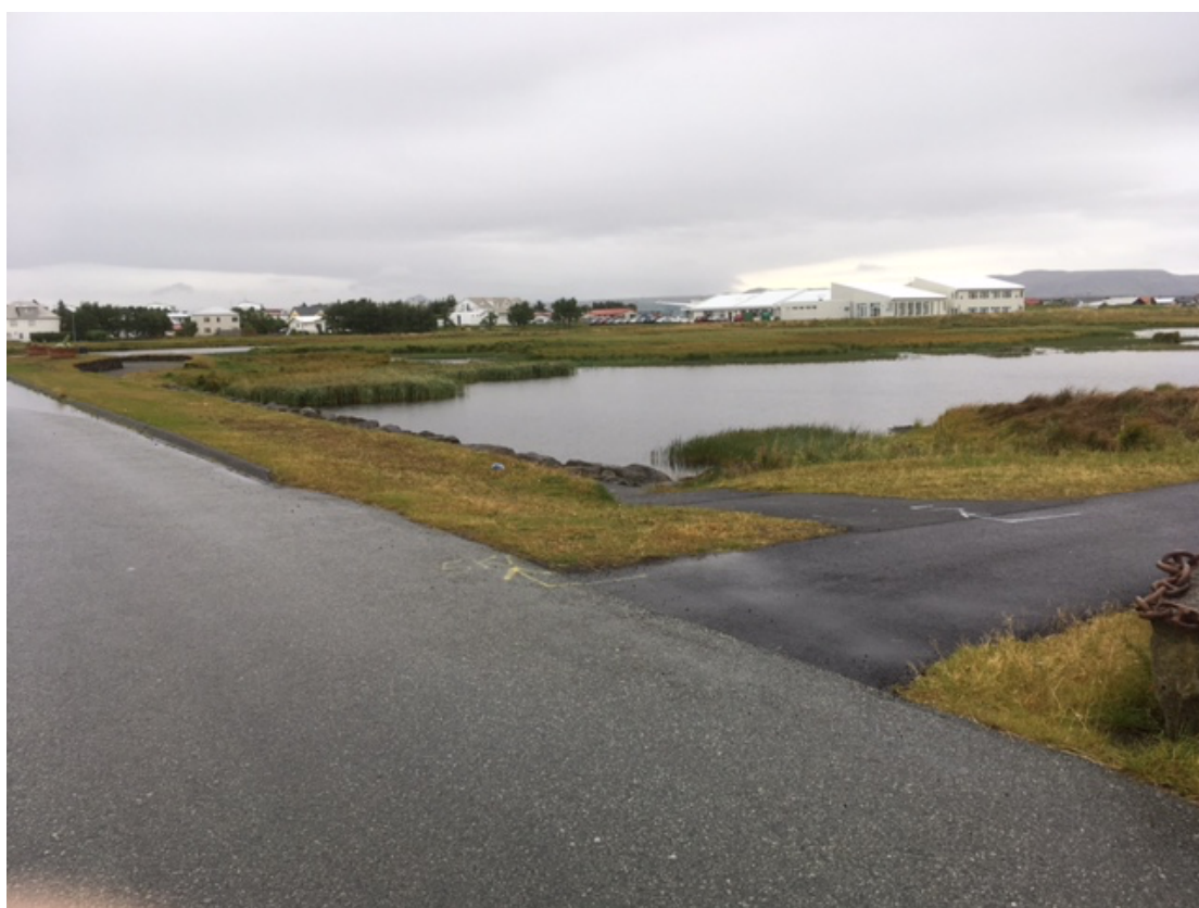
Göngustígur neðst í Hafnargötu, nærmynd til austurs.