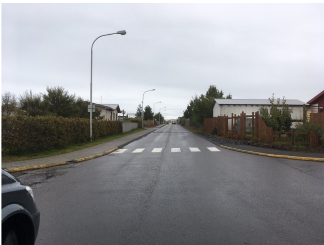
Stapavegur-Leirdalur-Brekkugata ? eldri stígar og gangbraut.