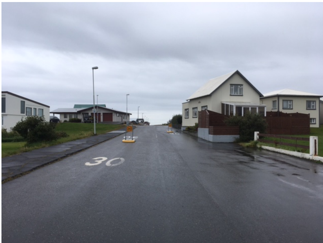
Bráðbirgðaprenging á Egilsgötu. Hraði 30 km/klst bæði á götu og skiltum.