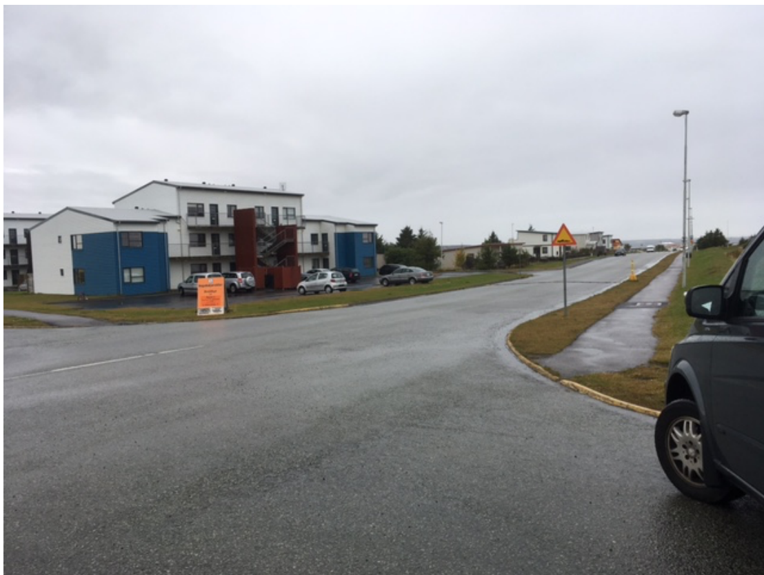
Stapavegur-Hafnargata-Vogavegur-Vatnsleysustrandarvegur. Horft til norðausturs.