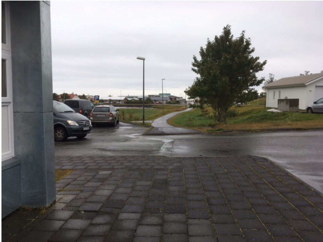
Göngustígur, sem kemur að Vogaskóla úr suðri.