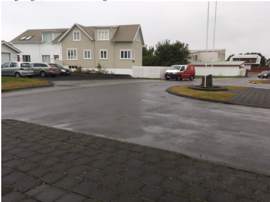
Hellulagðar gönguleiðir við Stóru-Vogaskóla, en stórir malbikspletir fyrir bíla.