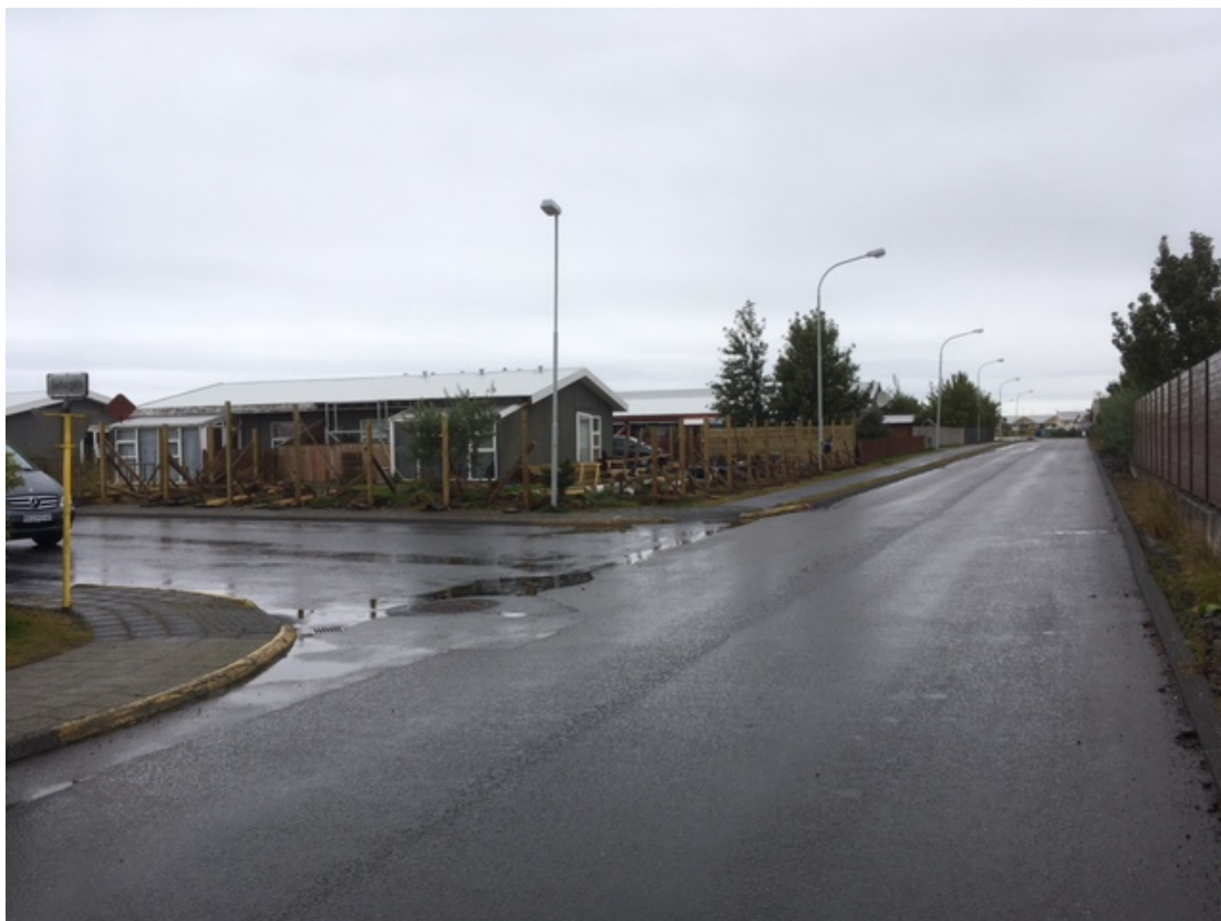
Suðurgata Stapavegur. Horft frá Stapavegi.