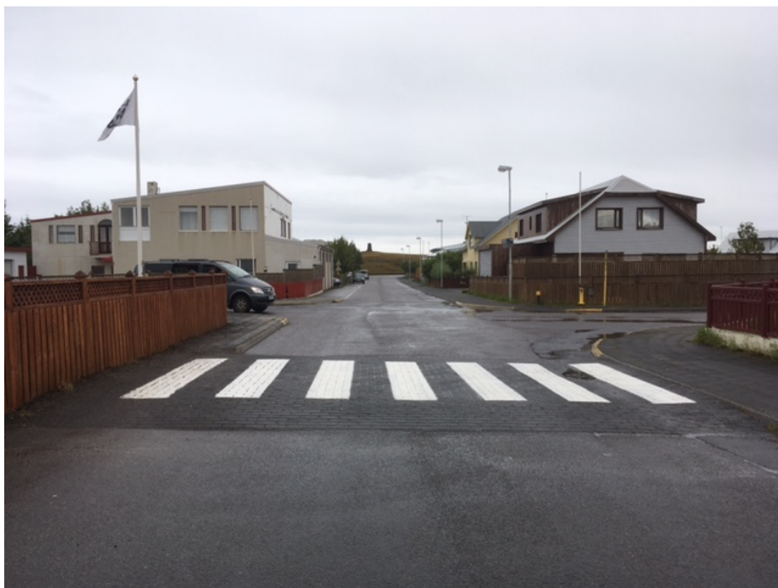
Tjarnargata-Vogagerði, aðeins gangbraut öðrum megin, vantar hinum megin.