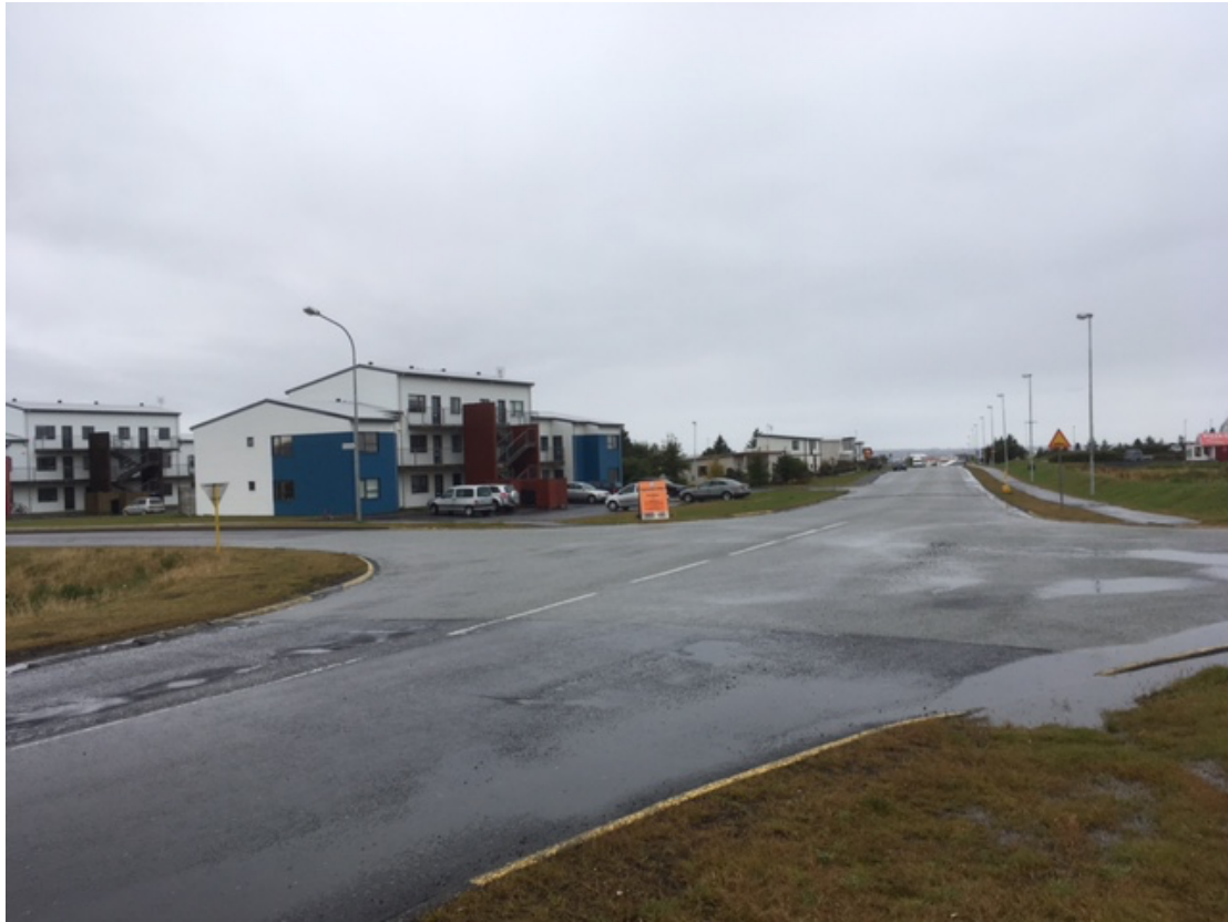
Stapavegur-Hafnargata-Vogavegur-Vatnsleysustrandarvegur. Horft til norðurs. Góðar aðstæður fyrir hringtorg.