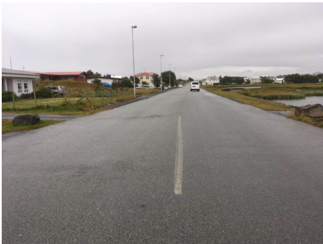
Göngustígur neðst í Hafnargötu, horft til suðurs. Hér er þörf á gangbraut og upphækkaðri hraðahindrun.