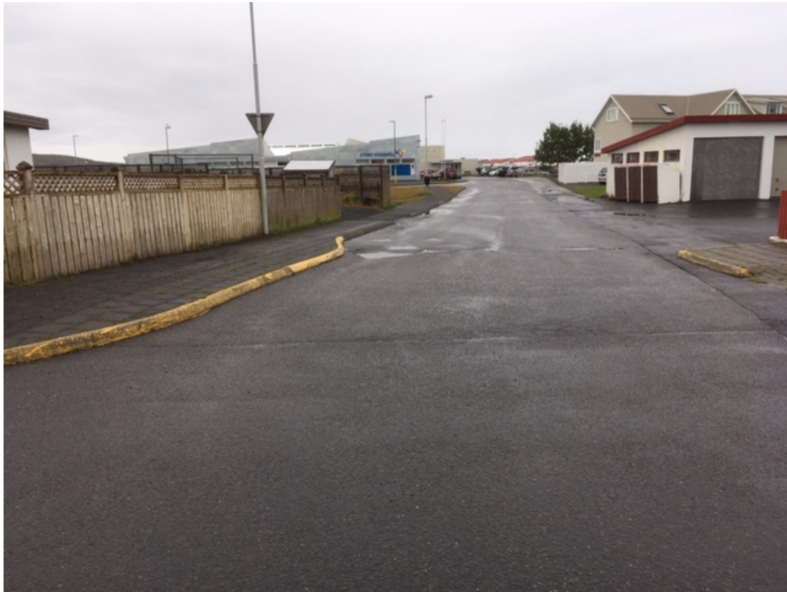
Horft niður Tjarnargötu frá Vogagerði.