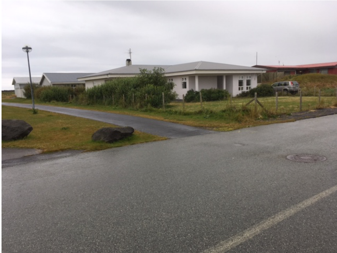
Göngustígur neðst í Hafnargötu, nærmynd vestari endi.