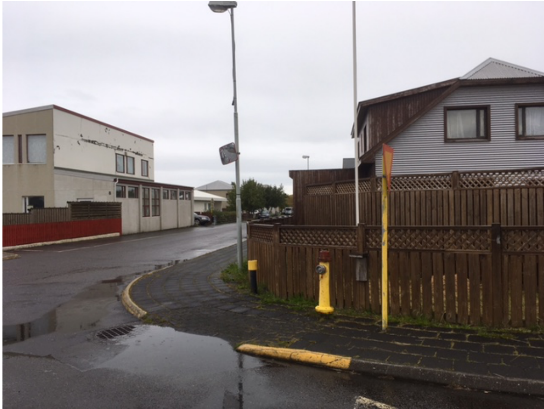
Tjarnargata-Vogagerði, aðeins gangbraut öðrum megin, eldri gangstéttir.