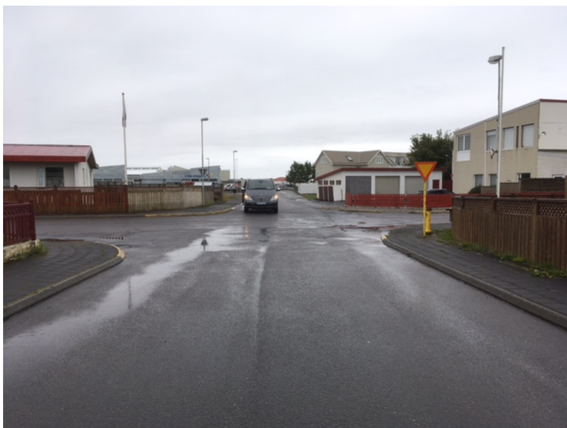
Tjarnargata-Vogagerði, aðeins gangbraut öðrum megin, vantar hinum megin.