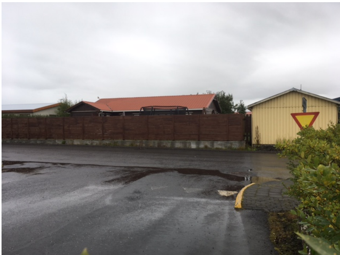
Suðurgata Stapavegur. Horft frá Suðurgötu. Biðskyldumerki sést illa. Klippa gróður.